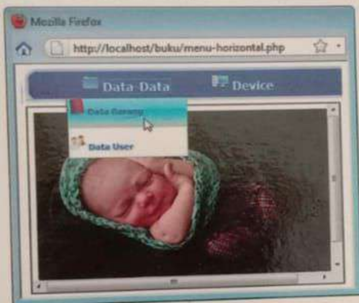
Menu berbentuk ikon dilengkapi content didalam IFRAME