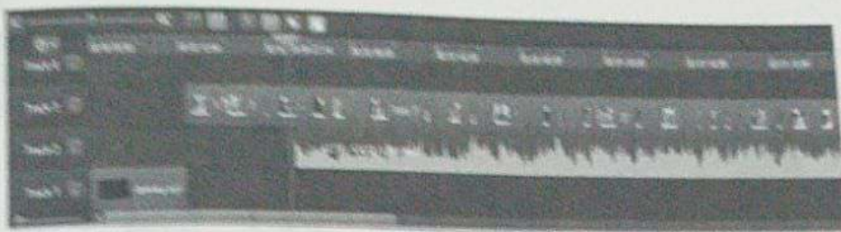
Gambar 1.26 Timeline yang sudah diisi oleh materi film

Di dalam Timeline, materi film dapat Anda pisahkan sesuai track-nya masing-masing. Misalkan saja track 1 untuk gambar, track 2 untuk suara, dan lain-lain. Keuntungan menggunakan Camtasia, Anda dapat menambah track sebanyak mungkin sesuai dengan kebutuhan. Track juga dapat dikunci supaya ketika Anda melakukan editing di track lain, track yang sudah selesai tidak tergeser.