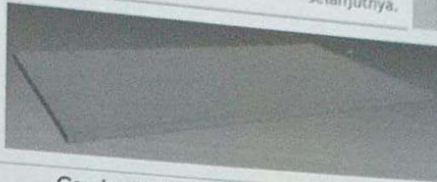
Gambar 1.2 Pembuatan objek box meja01