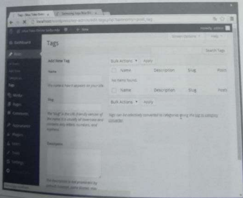
Gambar 1.83 Daftar tag yang sudah ada